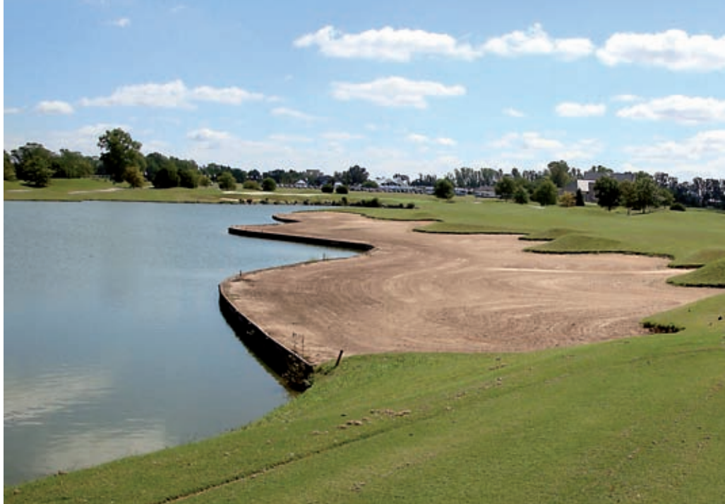
Trou 9 du Pilar GC à BA

Hôte de la World Cup en 2000 (Tiger Woods / David Duval), Buenos Aires, le «Paris de l'Amérique du Sud» offre de nombreux parcours autour de sa capitale, distants de 20 à 40 minutes. Un excellent climat et une qualité de maintenance exceptionnelle permettent, grâce à un bon drainage de jouer toute l'année sur la plupart des terrains, même par gros temps.