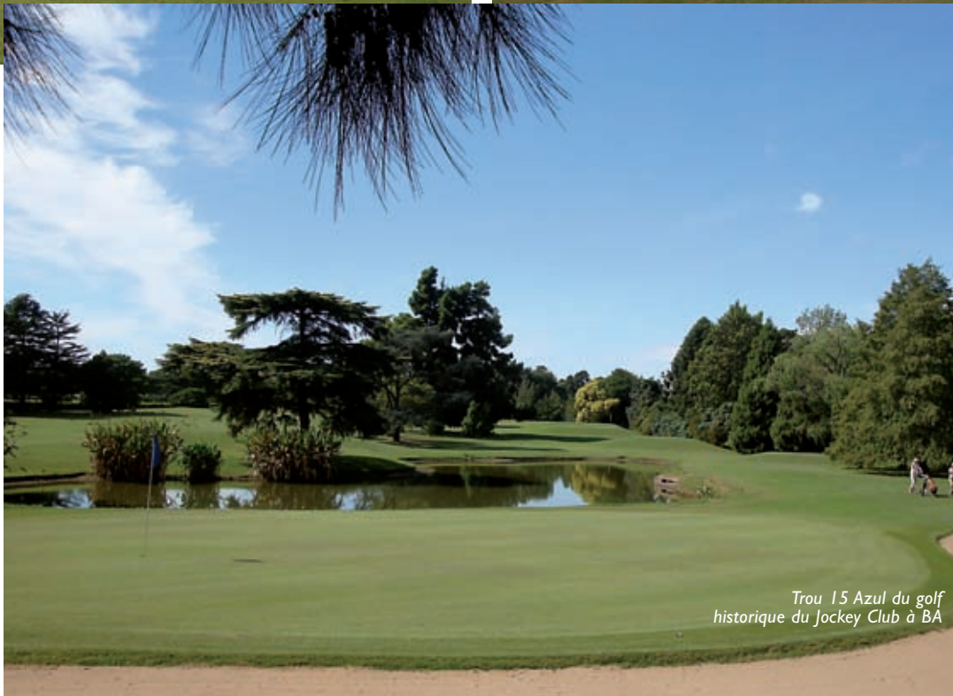
Trou 15 Azul du golf historique du Jockey Club à BA