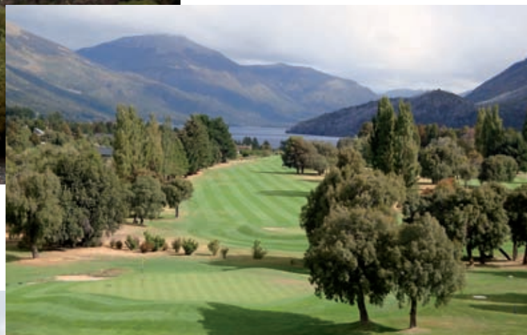
Somptueuse vue sur le lac et les montagnes du golf d'Arelauquen

Si l'Argentine est le pays avec la plus grande tradition golfique en Amérique latine depuis plus d'un siècle, le marché est