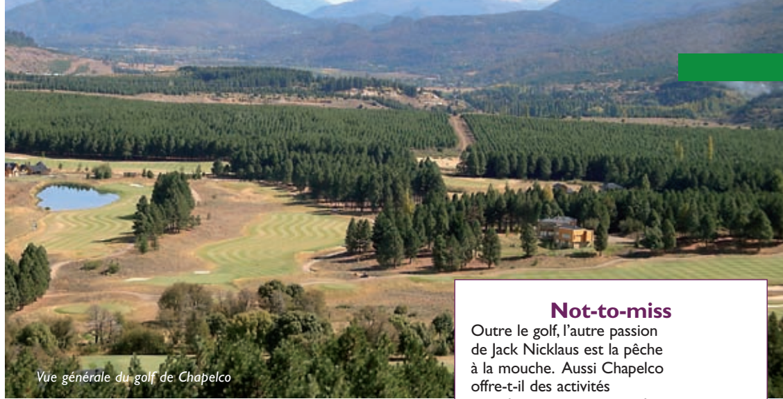
Vue générale du golf de Chapelco

El Refugio chalet-restaurant situé à 1300 m d'altitude au cœur du parc national.