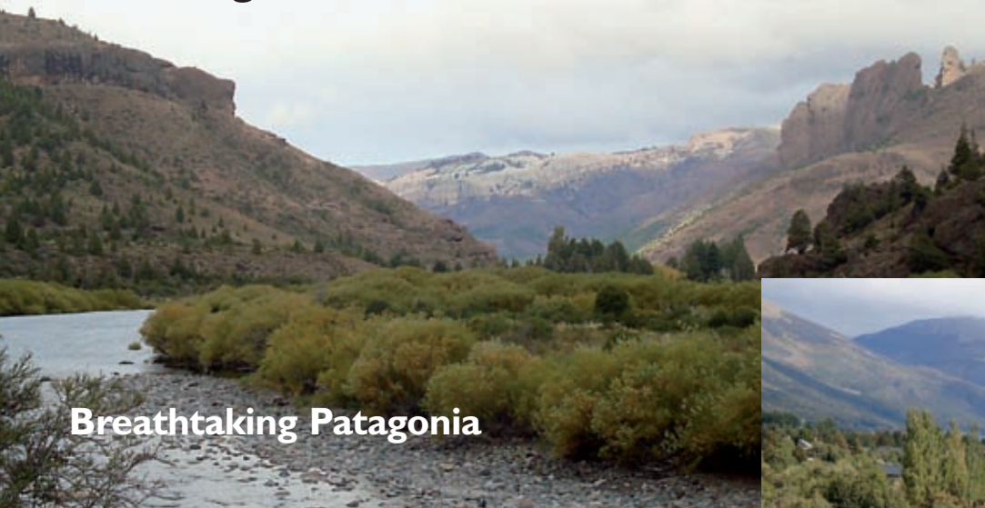
Voici la Patagonie : rivières, montagnes et silence...