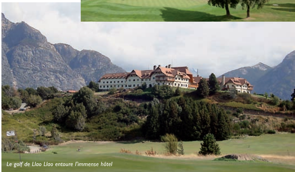
Le golf de Llao Llao entoure l'immense hôtel

concentré à 80% dans la région de Buenos Aires. Aussi, pour convertir la Patagonie au tourisme international, seuls des grands designers et des hôtels de grand luxe peuvent y parvenir. Un superbe choix de types de terrains retiendra votre attention : traditionnels dans les déserts exotiques du nord, les lacs et montagnes de Patagonie jusqu'à l'ultime expérience du golf situé le plus au sud de la planète : Ushuaia (Revue Golf avril 2008). Il est à noter que l'exceptionnelle qualité des terrains est due à un entretien rigoureux, un bon drainage et à la couverture « chauffante » des greens durant les longues périodes de gel.